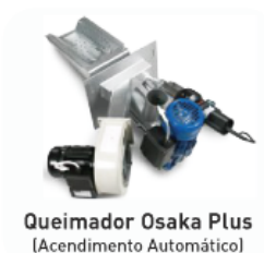
Queimador Osaka Plus (Acendimento Automático)