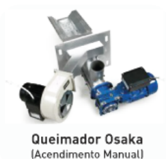
Queimador Osaka (Acendimento Manual)