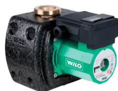
corpo em bronze